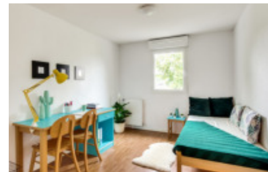
Photo de l'intérieur des logements

Certains logements ont été conçus pour accueillir des personnes à mobilité réduite.